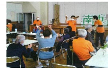
音楽レクリエーション

「支えあいネット♥みなみ」が6年目を迎えます。今も、地元高齢者の触れ合いの場となっています。健康維持を目指す場であり、元気に活躍できる場でもあります。参加される皆さんの笑顔と元気をこれからも応援していきます。