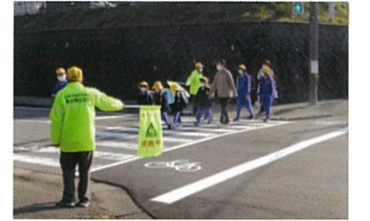
交通安全協会の皆さんによる横断歩道の見守り