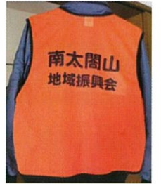
振興会のビブス作りしました

始業式(4/6)、入学式(4/7、4/8)と新学期が始まりました。始業式には在校生の子どもたち、入学式には新1年生が登校してきます。「おはよう」「おはようございます」元気な声が飛び交う朝です。小学生・中学生の1年生の皆さん、入学おめでとうございます。これからはコロナに負けないで頑張ってください。私たちも応援します。