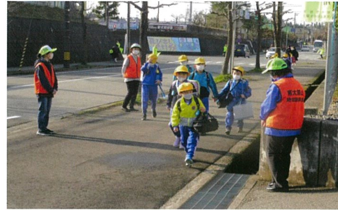
元気に登校「おはよう!」「おはようございます!」