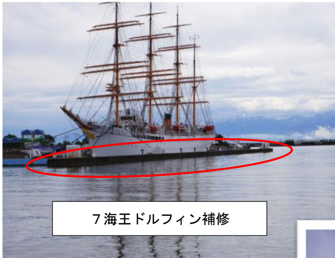
7 海王ドルフィン補修