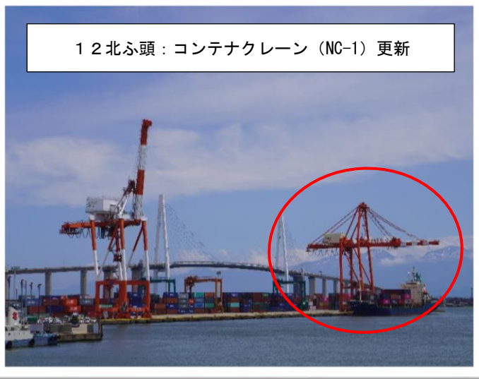
1 2 北ふ頭 : コンテナクレーン (NC-1) 更新