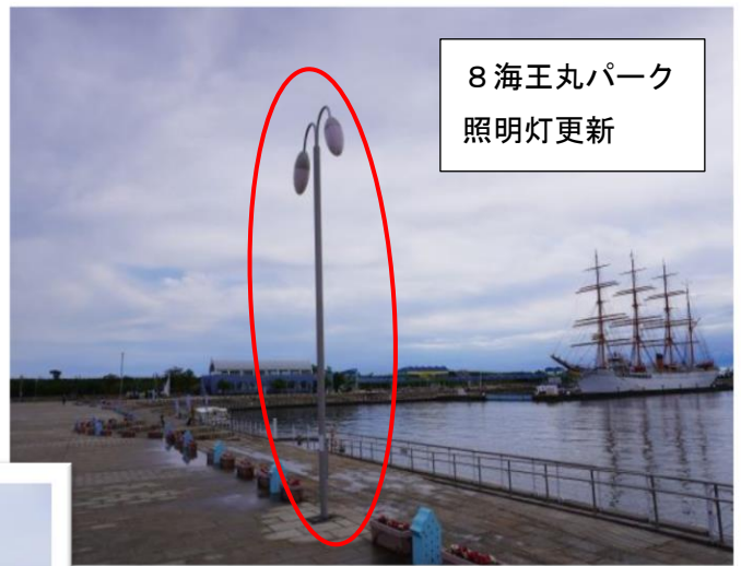
8 海王丸パーク 照明灯更新