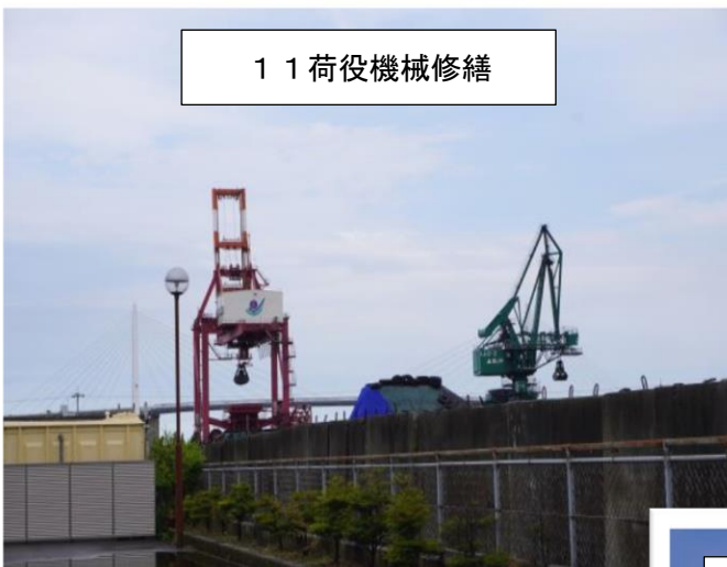
1 1 荷役機械修繕