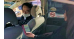
MaaSアプリを利用したタクシー配車（群馬県前橋市）