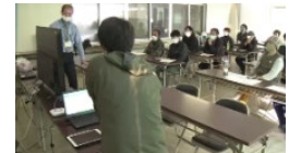
データを活用したスマート農業の取組（高知大学）