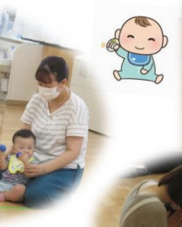
♪シャカシャカ♪ ♪コンコン♪