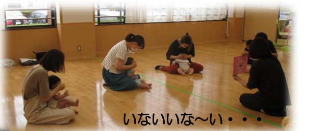
いないいな〜い・・・

パネルシアター『とんぼのめがね』 歌に合わせてとんぼが目の前に来ると、手を伸ばしたり ハッとしたり色々なかわいい表情が見られました。