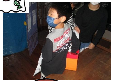
子ども達が楽しんでいる様子