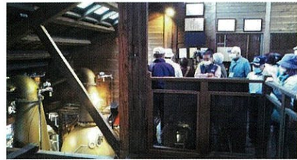
蒸留器(ポットスチル)