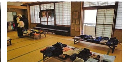
母親クラブ・どうぞ会(2階)