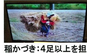
稲かづき:4足以上を担ぐ

ミュージアムの敷地内には、「情報館」、「伝統館」、「交流館」、「民具館」があり、散居景観の情報や伝統文化の魅力にふれることができます。