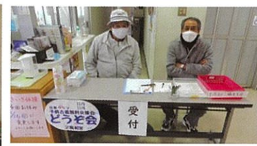
受付 (この日の担当:長寿会さん)