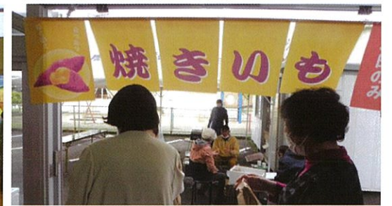
焼きいも 5日(土)のみ 美味しいよ!