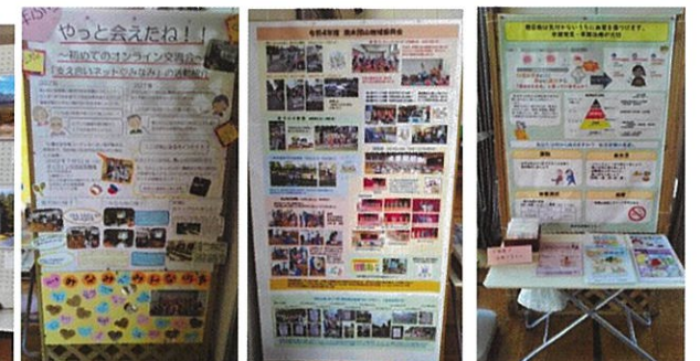
活動報告 振興会/みなみ/ヘルスボランティア