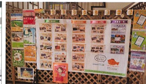
コミセン活動報告