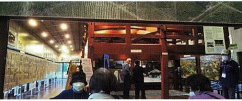
となみ散居村ミュージアム

若鶴酒造は、北陸で唯一のウイスキー蒸留所で、ウイスキーの試飲・お食事ができます。工場内を専属の係員の方に説明していただきました。