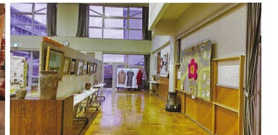
展示会場(南太作品展)