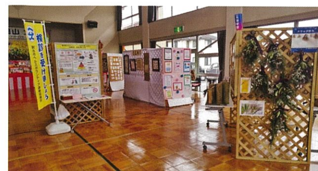
展示会場(コミセンサークル作品・生涯学習事業)

今年は、以前のように、南太閤山の皆さんに作品の展示をお願いしたところ、展示コーナー(南太作品展)いっぱいの作品が寄せられました。ゆっくりと作品が見れるように、スペースを取って、見やすい配置にして展示しました。大集会室で作品展、5日(土)だけの「焼きいも販売」、玄関で「ふれあい市」、「食品バザー」、2階和室で無料交換会「どうぞ会」と、ボランティアの方々のご協力がありました。コロナの行方がどうなるのかわかりませんが、今後も【文化祭】は継続していきたいと思ひます。