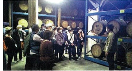
樽貯蔵庫(ウェアハウス)