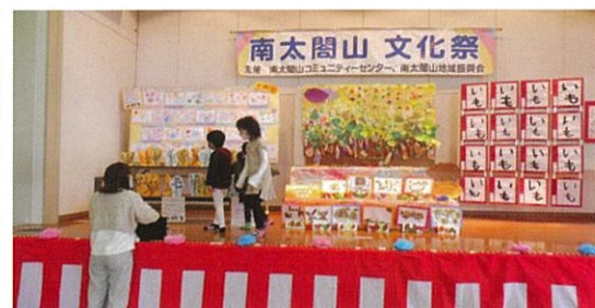
園児作品展： あいあい保育園 杉の子保育園 第三あおい幼稚園