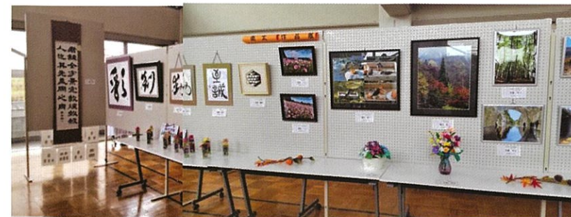
展示会場(南太作品展)