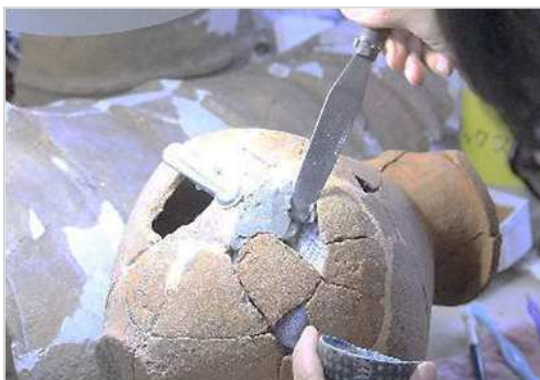
足りない部分を石こうでうめ、元の形にする