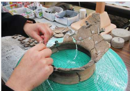
つながる土器片を探して、くっつける