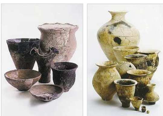
縄文土器【針原西遺跡】