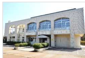
埋蔵文化財センター