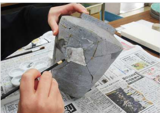
復元した石こうの部分に、周りと同色をぬる