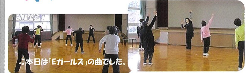
今日は「Eガールズ」の曲でした。

軽快なリズムに乗せて元気に体を動かします。自分の「ゆめ」を実現させるための体作りです。(^^)