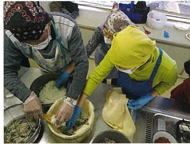
鮎寿司作り教室の様子