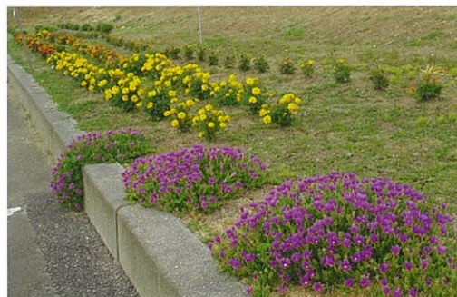
水辺の交流館周辺の植栽

大門地域振興会では、潤いのある住みやすい町づくりをめざし、地域の環境整備を進めています。6月には、水辺の交流館周辺と、防災広場等の花壇、植栽の整備を行いました。花いっぱい町になるといいですね♪