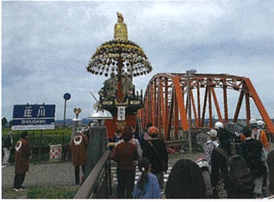
大橋を渡った枇杷首の曳山

令和4年10月9日、大門神社祭礼が行われました。一昨年の巡行中止、昨年の曳山展示のみの祭礼を経て、3年ぶりに巡行が再開された今回のお祭りに地元大門の人々は大喜び。法被姿の氏子が行き交い、露店も並んだ大門神社周辺はとても賑やか。聞こえてくる祭り囃子にみんな胸躍らせながら美しい曳山を眺めていました。