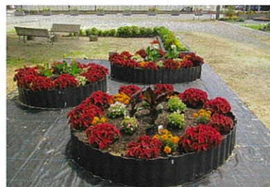
防災広場の円形花壇

大門地域振興会では、潤いのある住みやすい町づくりをめざし、地域の環境整備を進めています。6月には、水辺の交流館周辺と、防災広場等の花壇、植栽の整備を行いました。花いっぱい町になるといいですね♪