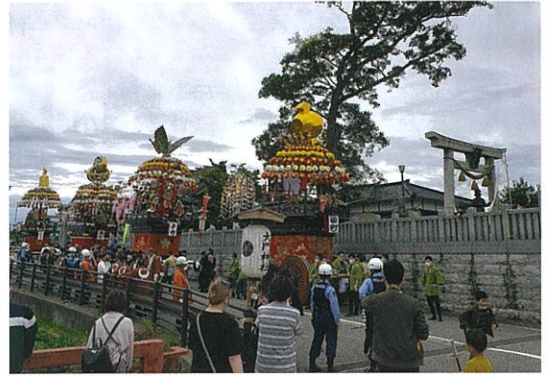
大門神社前に集合した曳山たち