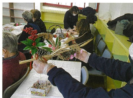
お父さん自慢のしめ飾り！