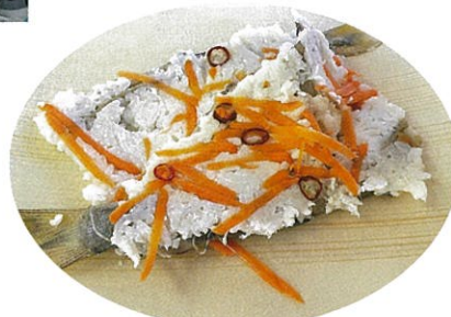
大門の郷土料理「鮎寿司」