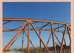
冬の青空に映える大門大橋

昨年、大門地域振興会では一昨年よりも活動の幅を少しずつ広げる事ができました。コロナと共に生きる術を身に着け、楽しく安心して暮らせる地域作りを目指し、スタッフ一同、今年も気持ちを新たに頑張ります。これからも活動へのご理解、ご協力のほど、よろしく願いいたします。