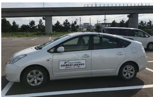
プローブカー（調査車両）

観光エリア等を経由するルートとして新湊地区、交通結節点である小杉駅から住宅が密集する太閤山団地を周回するルートとして太閤山地区を選定し、富山県立大学にGPS基準局を設置のうえ、プローブカー（LiDARやGNSSアンテナを搭載した調査車両）を用いた周辺環境の点群データ（地図情報の作成に必要なデータ）の採取、衛星からの電波（位置情報）受信による自己位置の特定、徒歩等による道路形状（歩道やガードレールの有無等）の調査を実施した。