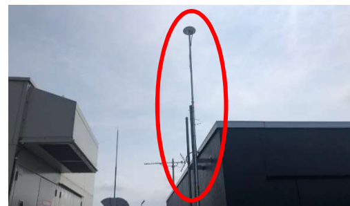
GPS基準局（県立大学屋上）

本調査で明らかとなる、公道での実証実験実施のための課題の解決に向けた取組を検討していく。