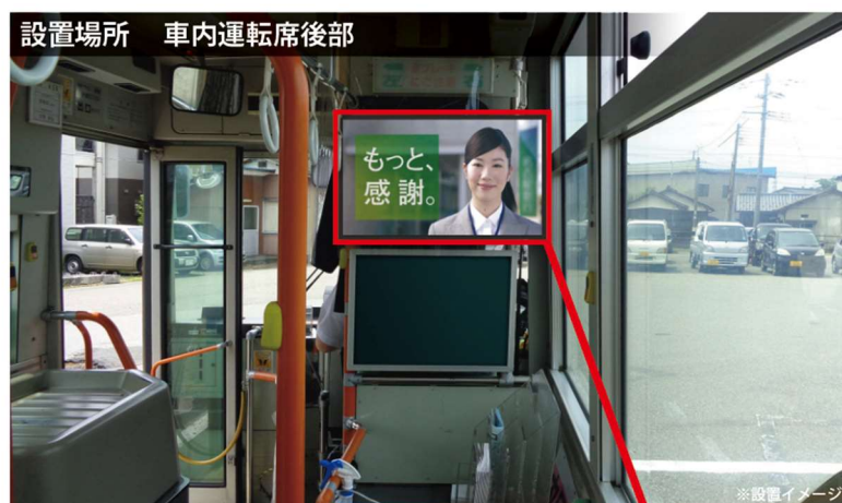
21.5 インチフルハイビジョンモニター