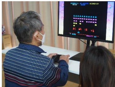
「インベーダーゲーム」