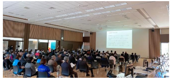
救急薬品市民交流プラザでの講演会の様子