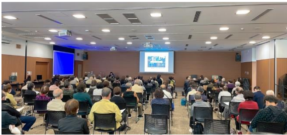
クロスベイ新湊での講演会の様子