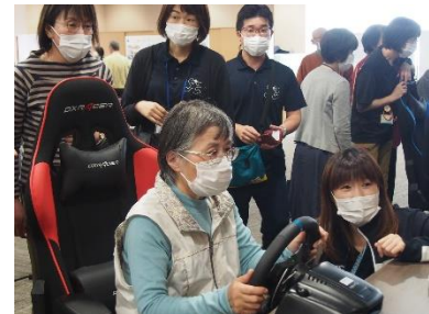
「グランツーリスモ」