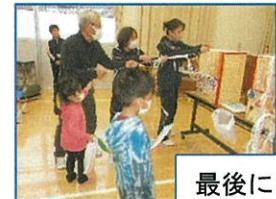
最後に糸引きくじ