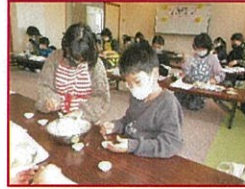
チョコレート作りに挑戦