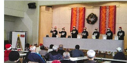
ハンドベルでクリスマスソング

♥火曜日 13:30~15:00頃 参加料 200円 ♥南太閤山コミュニティセンター 1階大集会室