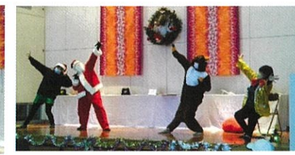
小杉南地域包括支援センター