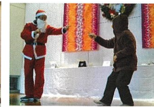
サンタとトナカイのダンス