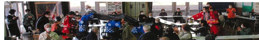
獅子舞 花(祝儀)を打つ。御礼口上:東西東西目録一つ、御酒沢山・人気栄富栄富・名代としての花の御礼。