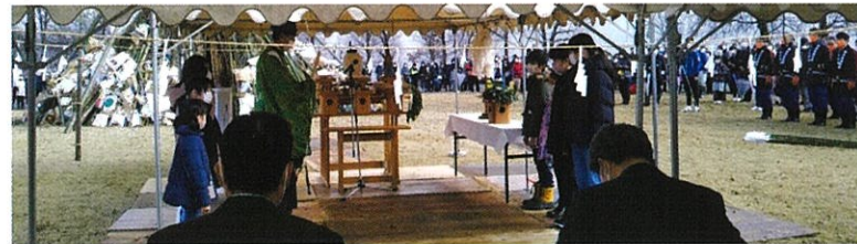
神事後、神火を分けて、櫓に点火

昨年はドライブスルー方式でしたが、今年は一般公開としました。太閤山3地域振興会がそれぞれ役割分担をもって、左義長は開催されました。南太閤山の今年の役割は櫓(やぐら)の組み立てで、各町内からの応援者を頂いて作業にかかりました。神事後、神火を各小学校から選ばれた子どもたちが消防団員と一緒に櫓に点火すると、火は勢よく立ち昇りました。縁起物を持参した皆さん方は、その櫓の周りを囲んで立ち昇る火炎に歓声を上げながら見物していました。来園者:13,192人、車:約2,000台(ランド発表)