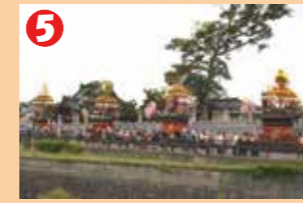
5 午前の巡行を終え、大門神社前に曳き揃えられた4基の花山を間近に見ることが出来ます。