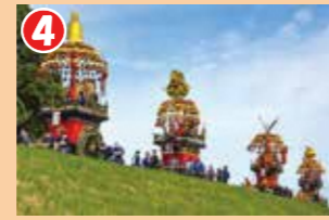
4 庄川沿いの見晴らしの良い場所です。花山は枇杷首神社まで進んでお祓いを受けます。