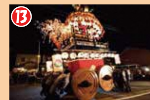
13 拍子木の合図で提灯山が勢いよく回転し、曳き別れとなります。その後、各町に戻って町内曳きが行われます。