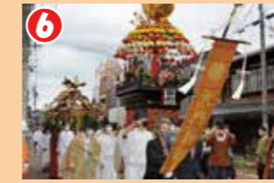
6 花山が午後の巡行を始めた後、大門神社を出発した神輿渡御の一行が氏子区域を廻ります。