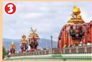
3 大門大橋を渡って大門と枇杷首を往復します。4基の花山が一列に連なって橋を渡る様子が見どころです。