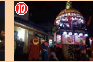
10 枇杷首の提灯山は、町に戻って単独で町内曳きを行います。最後に枇杷首神社で閉眼式が行われます。