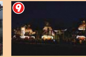
9 提灯山に装いをあらためた4基の曳山が大門神社前に曳き揃えられ、幻想的な姿を見せます。