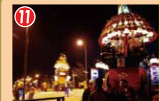
11 大門大橋の橋詰めで、枇杷首曳山が西町・中町・田町曳山のお神輿に送られて曳き別れます。