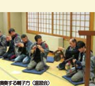
演奏する轆子方（温習会）

曳山が曲がり角に差し掛かると、拍子木持ちの「ヨッコ」の掛け声とともに曳き手が力を込めて曳山前方の轆を担ぎ上げ、そのまま前輪を浮かせながら方向を変えます。