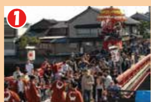
1 西町・中町・田町の3町の花山が大門神社へ向かう際に子供曳きが行われます。

10月21日の祭礼日に、放生津(おんげ)の船屋町から大門川原町(おんげ)に曳山が公開されています。