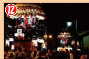
12 西町・中町・田町の3基の提灯山が、西町・中町・田町方面に向かって一列に連なり、田町方面に向かって巡行します。