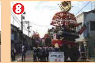
8 田町の東端で曳山はヨッコで勢いよく向きを変えます。ここで花山が曳き別れとなります。