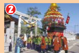
2 各町の曳山が、大門神社の鳥居前でお祓いを受けます。出発式の後、花山の巡行が始まります。