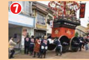
7 田町方面に曳山が進みます。巡行路両側の家々から祝儀が出され、右に左に「ヨッコ」が繰り返されます。