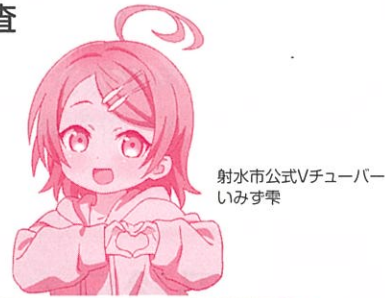
射水市公式Vチューバー いみず雫

特定健康診査・健康診査は、生活習慣病のリスクを高めるメタボリックシンドローム（内臓脂肪症候群）及びフレイル（高齢期の心身の衰え）に着目し、早いうちから病気になりやすい要因を判定し、生活習慣病予防に取り組むための検査です。 病気を未然に防ぐために、まずは健診を受けることが重要です！ 毎年健診を受けて、ご自身の体の状態をチェックしましょう。