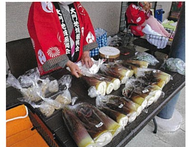
季節の旬の味が並びます！