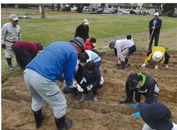
「こうやって植えるがいよ～！」

4月15日（土）、防災広場の畑にジャガイモの種芋が植えられました。世代を超えて、みんなで楽しく作業を進めることができました。