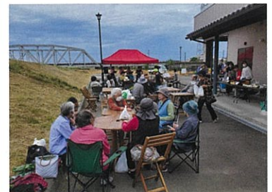
コンサートを楽しみながらのんびり♪