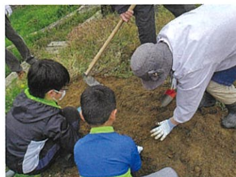
みんなで仲良く畑仕事♪