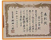
富山県知事表彰 無火災表彰綬 金山分団