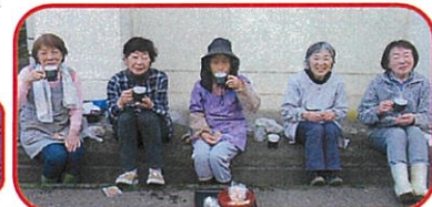
《作業を終えてホッと一服》