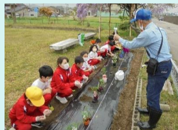
さんさんみつば広場の子どもたちが六渡寺公園 にてトマトの苗植えと収穫を楽しみました。

地域の高齢者、親世代、子どもたちが少しずつでも今 の変化の状況を受け入れ知恵を出し支え合いなが ら、庄西地区全体が笑顔の絶えない元気な町であつ てほしいと願うばかりです。令和5年度は、私たち第 3層コーディネーター4名で庄西地区の皆様と共に 支え合って寄りそい、事業に取り組んでまいります。