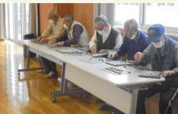
「脳トレーニング頑張りました!!」