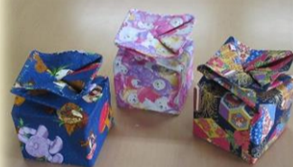
牛乳パックで 小物入れ作り