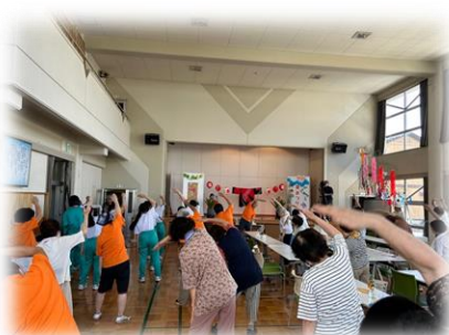
『100歳体操』で健康寿命を伸ばそう