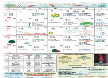
特製のカレンダーで行事の把握はバッチリ