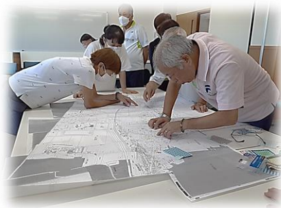
「資源マップ」作りで地域の特色を把握