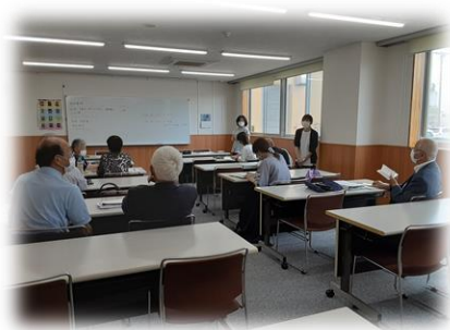
定例会を行い、地域活動について話し合います