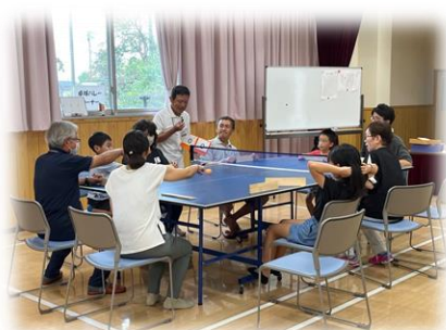
三世代交流会で仲良くなれたかな