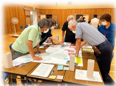
「地域課題会議」で自分たちの地域について改めて共有しよう