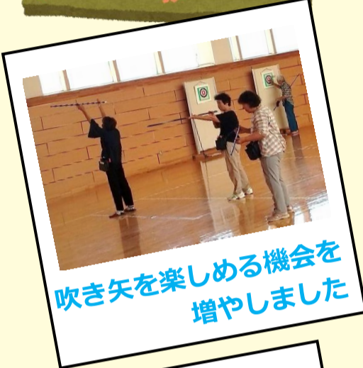
吹き矢を楽しめる機会を増やしました