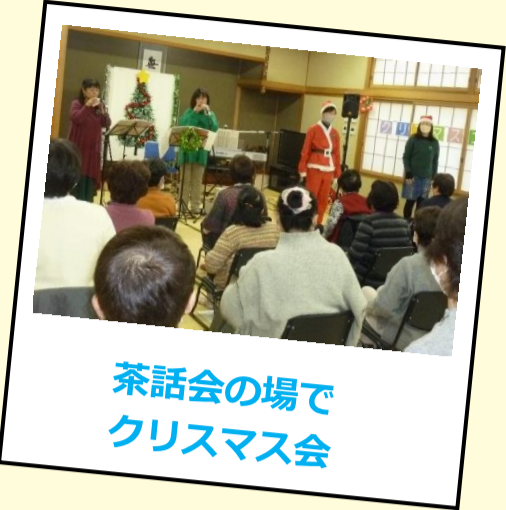
茶話会の場でクリスマス会

水戸田カフェ 13:30~ 毎月 第1 火曜 ぬりえ教室 13:30~ 毎月 第4 月曜 あみあみ教室(編み物) 13:30~ 毎月 第3 月曜