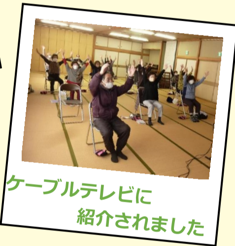
ケーブルテレビに紹介されました