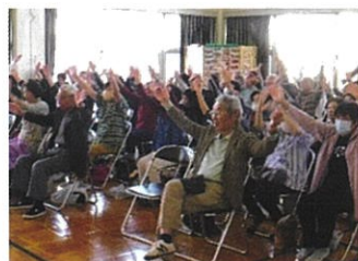
皆さん、 サザエさん体操に 合わせて元気に体操