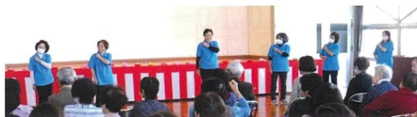
ヘルスポランテア サザエさん体操