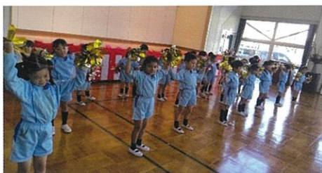
第三あおい幼稚園 歌