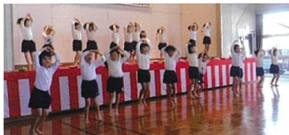
杉の子保育園 ダンス&歌