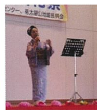
こまどり会 演歌カラオケ