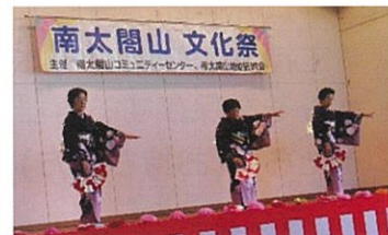
なでしこ教室 民踊