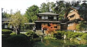
Bグループの皆さん