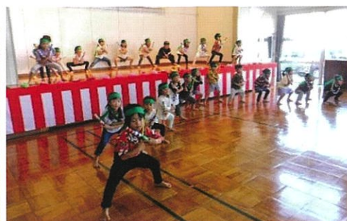
あいあい保育園 ダンス