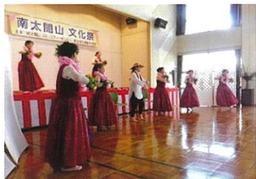
Q'sフラクラブ フラダンス