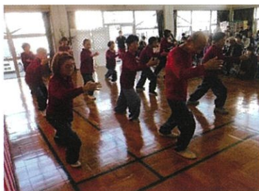
太極拳友の会 太極拳