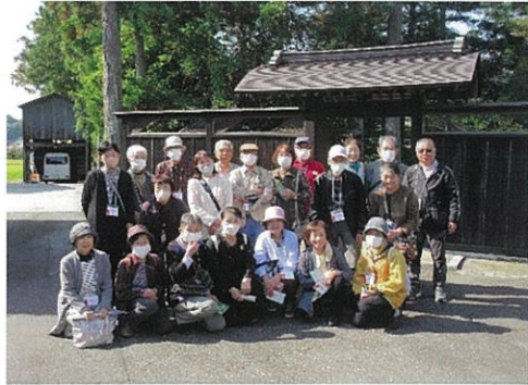
Aグループの皆さん