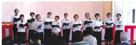
みなみ童謡の会 童謡・唱歌