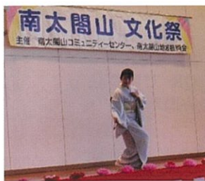
射水西川会 日本舞踊