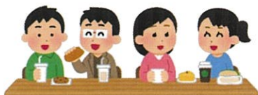
飲食・休憩スペース カフェ♥みなみ