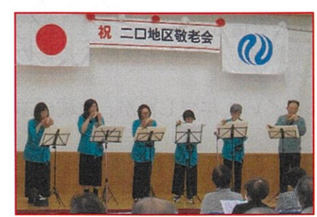
オカリナ ハートエンジェリーナ