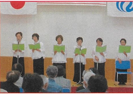
富山千吟会 なごみ教場