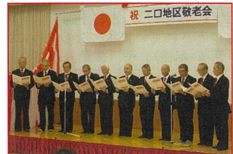
富山千吟会 二口教場