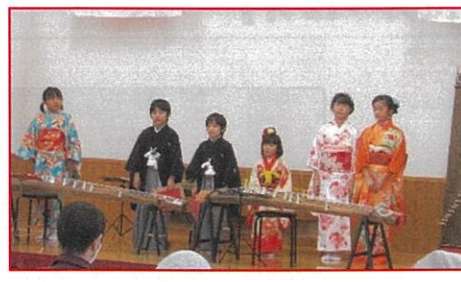
ふたうち子供おこと教室