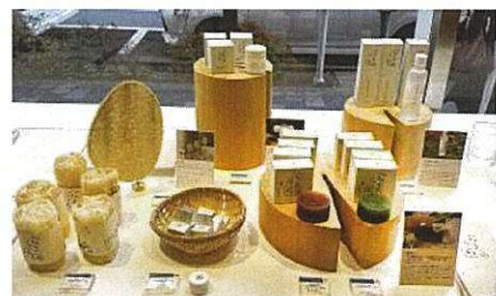
令和5年度「伴走型小規模事業者支援推進事業」