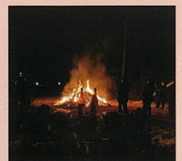
令和6年の左義長の様子

昨年、地域で起こった水害、新年早々に起こった大地震など、心が折れそうになることが何度もありました。その度に助け合い、励まし合うのは同じ地域に暮らす仲間達です。防災に対する意識を高めながら、みんなでこの地域の安全を守ってゆきたいものです。これからもこの町で安心して暮らしたいという願いがこもった左義長の火の粉が、今年も天高く舞い上がりました。