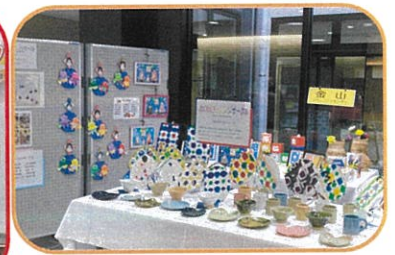
《当センターの作品展示》