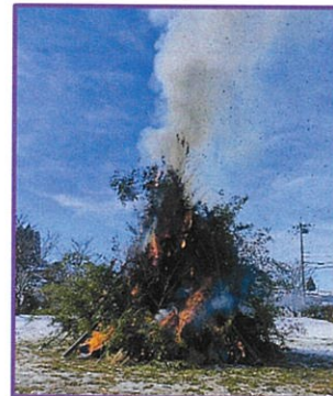
1/14(日)上野 上野公民館 正午点火

今年も5つの町内会で左義長が行われました。大地震のあとの左義長でしたので、例年とは違う面持ちで参加された方も多かったのではないのでしょうか。左義長で燃やすものにまつわる言い伝えが数々あります。みなさまは何を祈願なさいましたか。