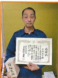
《賞状と記念品を持って》

出初式が地震の影響で中止となり、1月25日に予定の文化財防火デー(翁徳寺)での訓練も中止になりました。