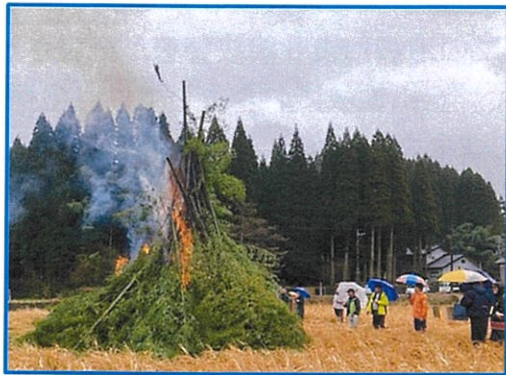
1/7(日)野手 水上谷遺跡 午後1時半点火