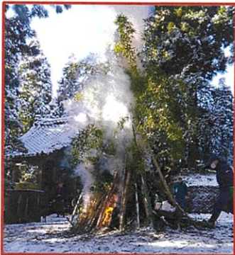
1/14(日)宿屋 神明宮境内 午前9時点火