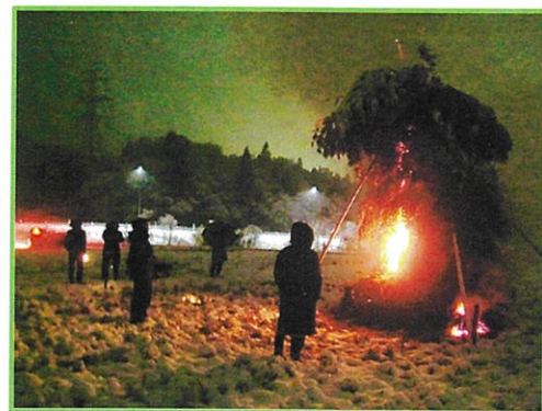
1/13(土)平野 田んぼの中 午後6時点火