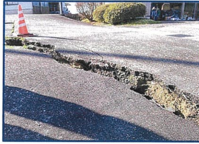
《上野地内の道路でひび割れ》

改めて、日頃の防災意識を高めるとともに、地域のつながりの大切さを感じた方が多かったのではないのでしょうか。射水市では様々な対応を行っています。市のホームページ、もしくはコミュニティセンターにある「市の対応の一覧表」でご確認ください。