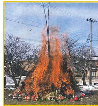
1/14(日)青井谷 青井谷公民館 正午点火