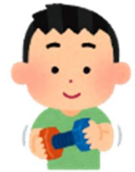
(生涯学習・スポーツ課)