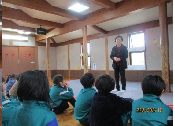
クイズを考えている様子