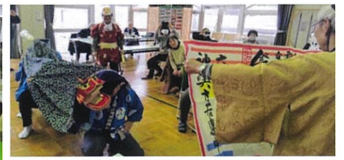
★新年の集い(獅子舞 1月16日)★