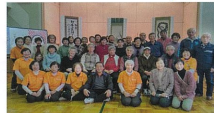
新年の集合写真(1月9日)