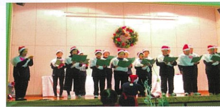
元・少年少女合唱団 ♪。♪。♪