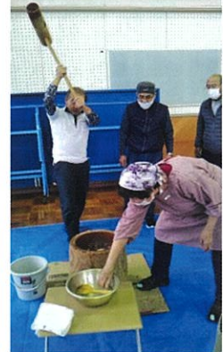
餅つき & 門松づくり