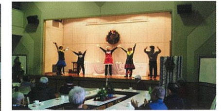
★クリスマス会(12月19日)★