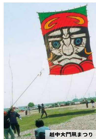
越中大門凧まつり