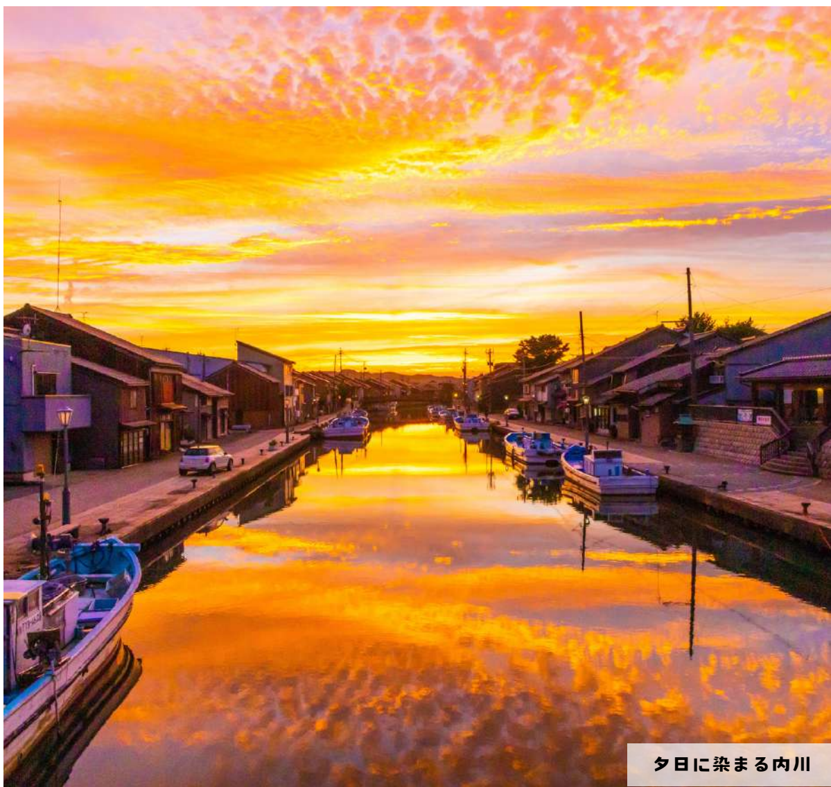
夕日に染まる内川