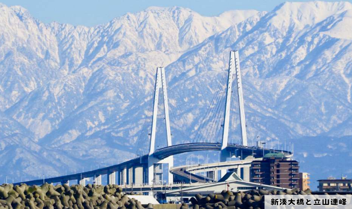
新湊大橋と立山連峰