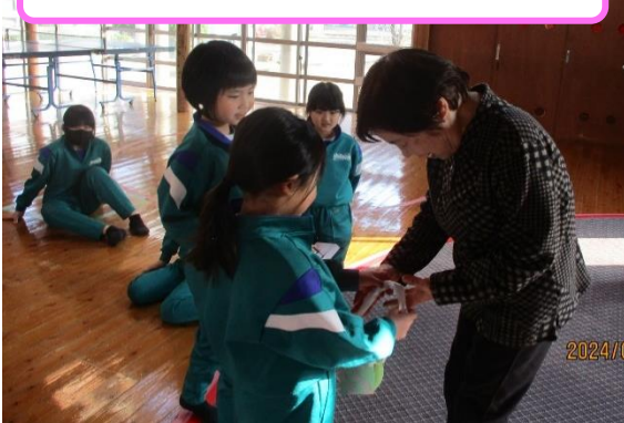
プレゼントを渡している様子