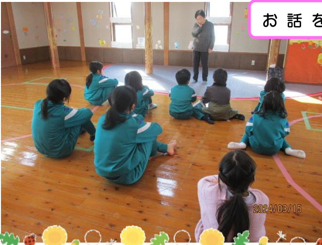
お話を聞いている様子