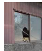
窓が割れた 管理不全空家