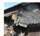
緊急代執行を要する 崩落しかけた屋根