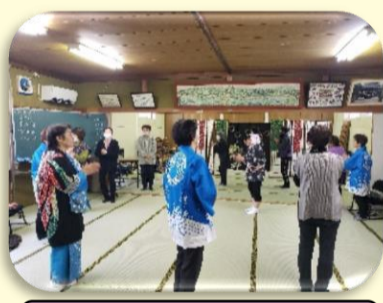
大正琴・輪踊り (西高木)