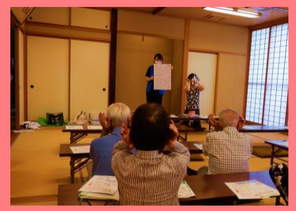
保健センターの講演会