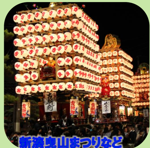
新湊曳山まつりなど