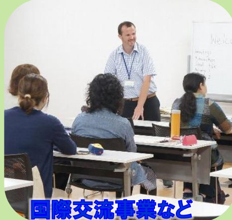
国際交流事業など