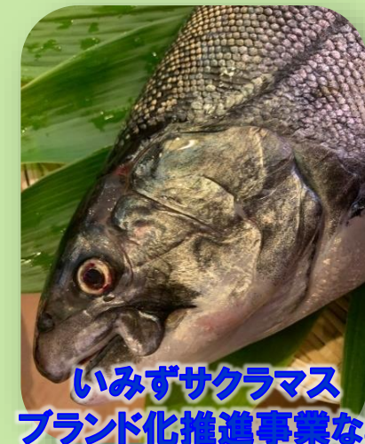
いみずサクラマス ブランド化推進事業など