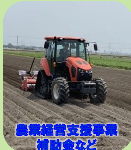
農業経営支援事業 補助金など