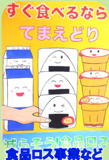
すぐ食べるなら てまえどり 減らそう!食品ロス 食品ロス事業など