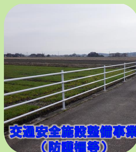
交通安全施設整備事業 (防護柵等)