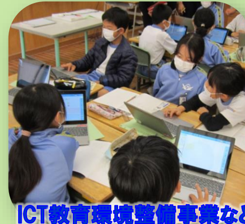
ICT教育環境整備事業など