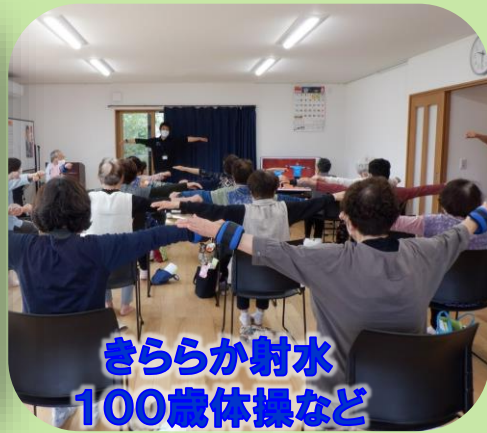
きららか射水 100歳体操など