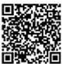
▲日本年金機構ホームページ