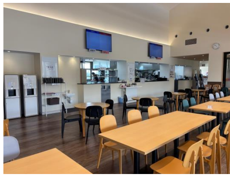
いみずキッチン(フードコート)