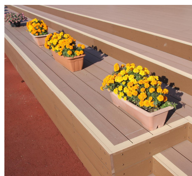
広場に面したベンチ

物産館と食遊館をつなぐ広場には、フォトスポット(文字モニュメント)のほか、射水の魅力や道の駅の絶品フードメニューのかわいいイラストが来場者をお出迎えします。