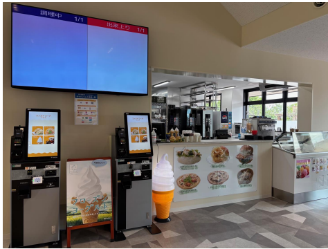
いみずCAFE(ファストフード)