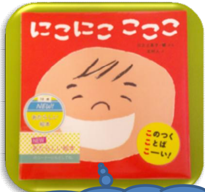
思わず声を出したくなる、 楽しい赤ちゃん絵本です☆