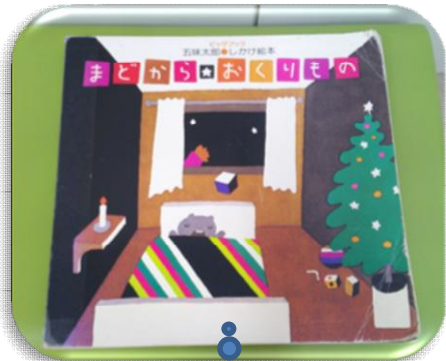
大型仕掛け絵本で赤ちゃんたちも夢中！今の季節にぴったりおすすめです☆