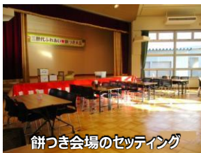
餅つき会場のセッティング