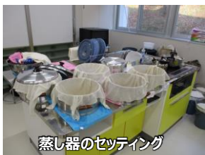
蒸し器のセッティング

12/7(土)のことです。当日、来館していただく地域の方々の笑顔を思い浮かべながらみんなで準備しました。飲食ルームの中央には「雪の立山」と題して立山とコスモスのレリーフも飾りました。