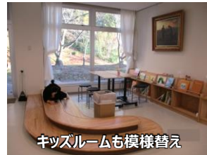
キッズルームも模様替え