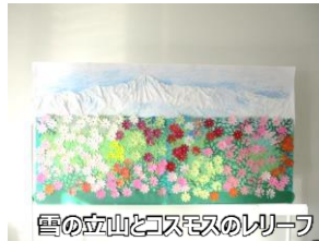
雪の立山とコスモスのレリーフ