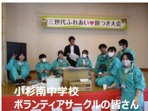
小杉南中学校ボランティアサークルの皆さん