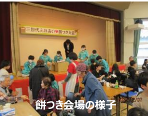
餅つき会場の様子