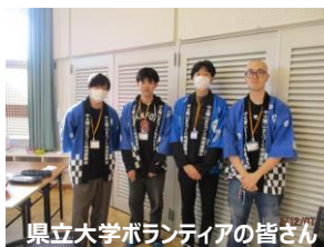
県立大学ボランティアの皆さん

12/8(日)のことです。県立大学のボランティアの皆さんには、当日の開会式が始まる前には会場の各備品のセッティングや餅つき大会が始まると餅をついたり、お湯の交換などをして頂きました。先に仕事の内容を聞いた人が遅れて来た人に仕事の内容を教えるなど学生同士の連携がとれているので大変助かりました。ありがとうございました。