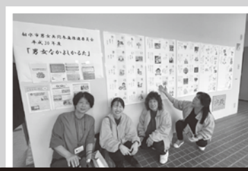
10月 富山福祉短期大学「ふくたん祭」