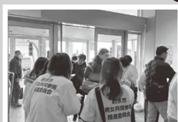
3月 オレンジキャンペーン