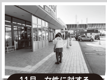
11月 女性に対する暴力をなくす運動