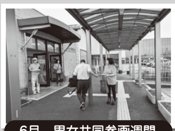
6月 男女共同参画週間