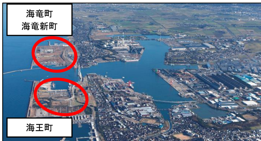
(図3) 海王町、海竜町、海竜新町

東側に日本海側最大級の停船施設「新湊マリーナ」、西側に帆船海王丸が係留される「海王丸パーク」、両岸を日本海側最大級の新湊大橋でつなぐ射水ベイエリア。リゾートホテルの利用が検討できるエリア。