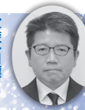
福祉保健部長 菅原 剛史