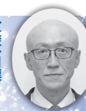
産業経済部長 塩谷 明永