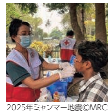
2025年ミャンマー地震

▶紛争や災害、病気などに苦しむ人々を救うため、世界191の国と地域からなるネットワークを活かした人道支援活動を行っています。