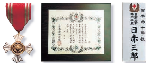
(個人:金色有功章) (個人:銀色有功章) (個人:特別社員) (法人:銀・金色有功章) (個人:銀・金色有功章)