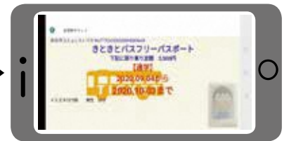
2. 乗務員に提示する。