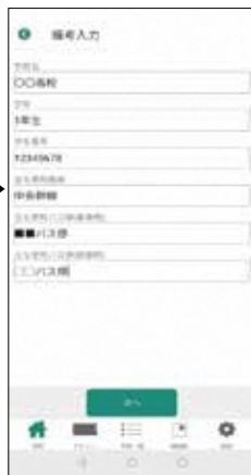
3. 各項目を入力する。 ※券種によって入力内容は異なります。 ※普通定期の場合は不要です。