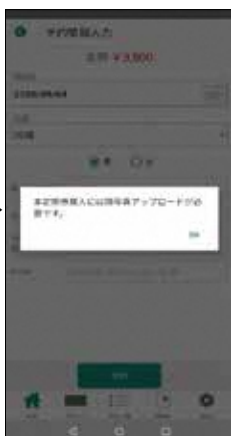
5. 顔写真をアップロードする。 ※普通定期の場合は不要です。