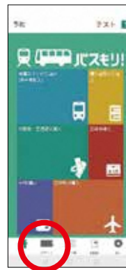
1. チケットを選択する。