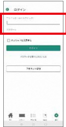
2. ログインID(メールアドレス)、パスワードを登録する。