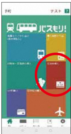
1. 定期券購入を選択する。