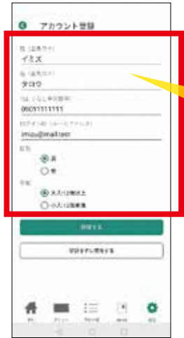
3. 姓、名、電話番号、性別、大人・小人を登録する。