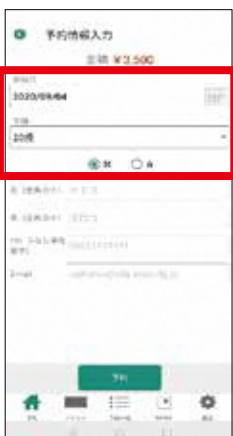
4. 開始日等を選択する。 ※開始日の14日前から購入できません。