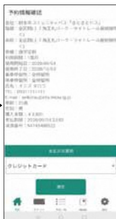
6. 予約情報を確認し、支払い方法を選択する。アカウント登録したメールアドレスに予約・支払完了メールが届く。